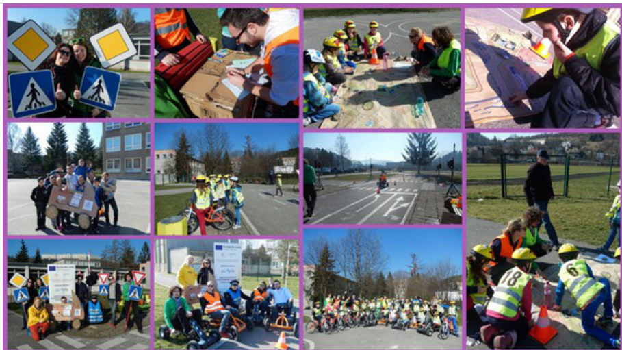
Štarter NP PRAKTIK / Autor Jana Šmýkalová

Každý z nás rád investuje energiu a čas do vecí, ktoré majú hodnotu. Nie vždy sa táto energia hneď vráti, pretože niektoré výzvy sú dlhodobé a vyžadujú si strategické a zodpovedné konanie. Takou oblasťou je aj práca s mladými ľuďmi. Práca s mládežou si vyžaduje veľa energie a ochoty počúvať. Mladí ľudia potrebujú priestor na využitie svojho potenciálu, na plnohodnotné trávenie voľného času, možnosti výberu kvalitného vzdelania a to nielen spoza školských lavíc.