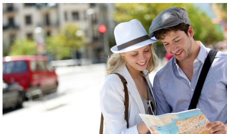
Cestujúci mladí ľudia

Globálna politika a jej apely sa dotýkajú závažných krokov, akými sú porušenie základných práv a slobôd, ekonomická nerovnosť či zlý stav životného prostredia. Súbor opatrení, ktoré prijali členské štáty ako riešenie proti diskriminácii, sa týka mobility mládeže v prostredí globálnej politiky na všetkých jej úrovniach, podpory „zeleného“ spôsobu života, v zmysle zdôraznenia významu recyklácie a šetrenie energie.