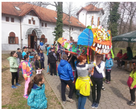
Tábor Zaži-to, Mojmirovce, Nitriansky kraj

Ďalšie vzdelávanie mladých vedúcich, mládežníckych vedúcich a pracovníkov s mládežou uskutočňované mimo formálneho vzdelávania je hlavným predmetom činnosti organizácie IUVENTA - Slovenský inštitút mládeže. Aktivity neformálneho vzdelávania naplňa prostredníctvom organizovaných vzdelávacích činností, čím prispieva k získaniu nových vedomostí, praktických skúseností a zručností potrebných pre prácu s mládežou. Robí tak s cieľom prehĺbiť, rozšíriť a doplniť získané vzdelávanie. Túto činnosť IUVENTA - Slovenský inštitút mládeže zabezpečuje prostredníctvom zamestnancov, ktorí disponujú odbornou spôsobilosťou na výkon špecializovaných činností v oblasti práce s mládežou, tak ako to ukladá zákon.