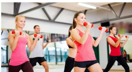
Športujúci mladí ľudia

Oblasť zdravia ako podpory skvalitnenia fyzického a psychického zdravia sa prelína s oblasťou športových aktivít mladých ľudí. Cieľom je prepojiť prácu pracovníkov s mládežou so športovými organizáciami a odborníkmi z oblasti zdravia. Táto medzirezortná spolupráca prispieva k propagácii rizík a aktuálnych hrozieb v oblasti zdravia za účelom prevencie zdravia mladých ľudí.