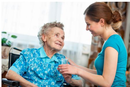
Dobrovoľnícka práca

Dobrovoľnícka činnosť má veľký význam pre sociálnu súdržnosť, občianstvo, medzigeneračnú solidaritu. V oblasti práce s mladými ľuďmi Stratégia Európskej únie pre mládež – investovanie a posilnenie postavenia mládeže identifikovala dôležitosť podporovať dobrovoľnícku prácu mládeže s cieľom odstraňovať prekážky v tejto činnosti, zvyšovať povedomie o hodnote dobrovoľníckej práce, uznávať dobrovoľníctvo ako dôležitú formu neformálneho vzdelávania a posilňovať mobilitu mladých dobrovoľníkov.