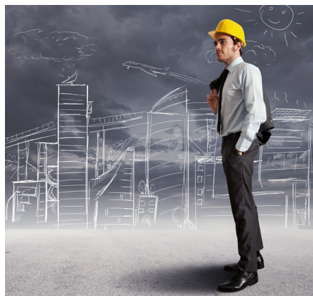
Mladý podnikateľ