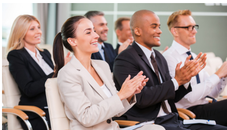
Mládežnícky parlament

Členské štáty sa zhodli na tom, že je nevyhnutné zapojiť mladých ľudí do občianskeho a politického života, aby aj oni mali účasť na dôležitých rozhodnutiach. Toto zapojenie by zabezpečilo lepší občiansky život, demokratický prístup mládežníckym organizáciám, lepšiu informačnú sieť. A v neposlednom rade tak veľmi dôležitý dialóg medzi európskymi inštitúciami, v ktorých pôsobia mladí ľudia.