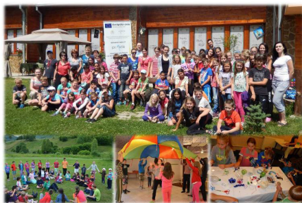
Tábor Zaži-to, Banskobystrický kraj

mladých ľudí a podporiť práve to vzdelávanie, ktoré tieto hodiny vyplňuje – neformálne vzdelávanie. Práca s mládežou je komplexnou a cielavedomou činnosťou. Vedie k zrelosti a sebaznaniu mladého človeka. Tak, ako to už bolo viackrát spomenuté, táto práca si vyžaduje profesionálny prístup, hoci je vo svojej podstate neformálna. Hodnota práce s mládežou nedosahuje zaslúžený rešpekt a prioritu. Hlavným úsilím je zadefinovať pracovnú pozíciu „pracovník s mládežou“ a zaradiť ju do Národnej sústavy kvalifikácií. Slovenská republika čelí výzvam a aktuálnym potrebám, ktoré si vyžadujú zosúladiť legislatívu, vytvoriť systém viac zdrojového financovania v oblasti práce s mládežou.