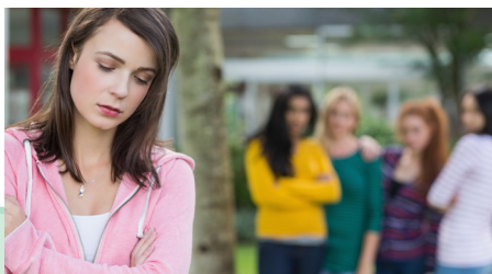
Znevýhodnené skupiny mladých ľudí

Sociálne problémy mladých ľudí sú odrazom stavu našej spoločnosti. Chudoba, strata zamestnania, diskriminácia, násilie a mnoho ďalších aspektov túto životnú situáciu prehľbujú. Sociálna ochrana mladých ľudí je povinnosťou, ktorá sa týka všetkých členských štátov. Opatrení na riešenie tejto situácie je hneď niekoľko – optimalizovať využívanie fondov Európskej únie na podporu sociálnej integrácie, využívať potenciál mládežníckej práce ako prostriedku pre začlenenie, zapojiť mladých ľudí do inkluzívnej politiky, riešiť bezdomovstvo a finančné vylúčenie, podporovať prístup ku kvalitným službám a osobitnú podporu mladým rodinám.