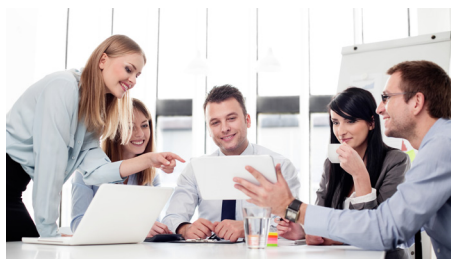
Pracujúci mladí ľudia