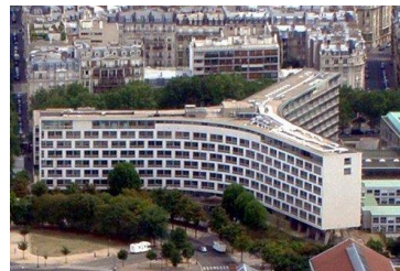
B. budova UNESCO, Paríž