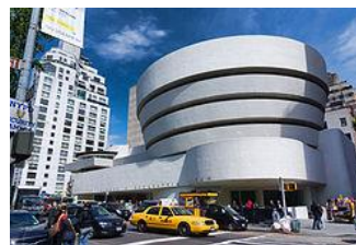
D. Guggenheimovo múzeum, New York