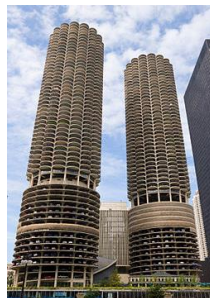
C. Marina City, Chicago