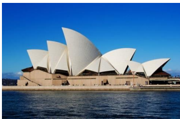
A. budova opery, Sydney